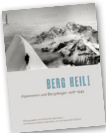
Buch zum Forschungsprojekt „Berg Heil! Alpenverein und Bergsteigen 1918–1945“. Köln, Weimar, Wien 2011.

Auch eine Reihe von Sektionen der Alpenvereine setzte sich intensiv mit der Ausgrenzung jüdischer Mitglieder auseinander: Mehrere Publikationen, unter anderem von den DAV-Sektionen Aachen, Bayerland, Berlin, Freiburg und Schwaben sind dazu erschienen. Am Dobratsch in Kärnten fand im Sommer 2011 eine Veranstaltung zur Erinnerung an das Betretungsverbot für Juden des damaligen Ludwig-Walter-Hauses statt, die von der OeAV-Sektion Villach mitinitiiert wurde.