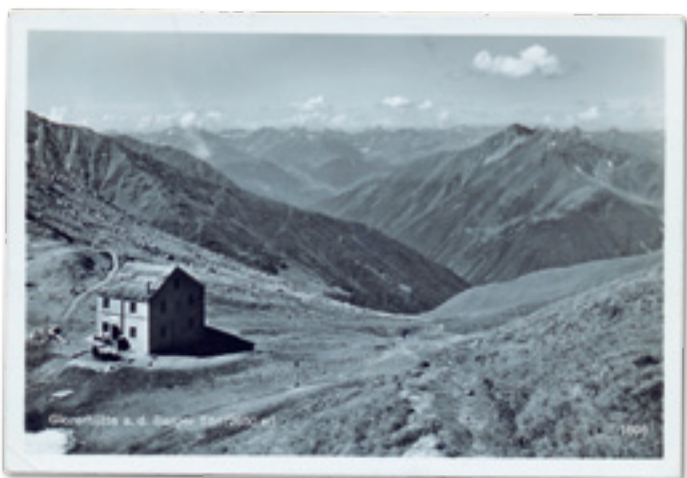
Glorer Hütte, Postkarte, um 1935.