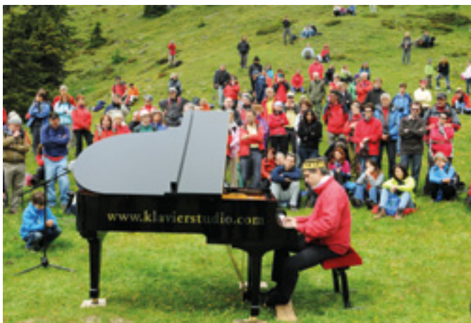
Villacher Aktion. Paul Gulda am Klavier, 2011.

Auch eine Reihe von Sektionen der Alpenvereine setzte sich intensiv mit der Ausgrenzung jüdischer Mitglieder auseinander: Mehrere Publikationen, unter anderem von den DAV-Sektionen Aachen, Bayerland, Berlin, Freiburg und Schwaben sind dazu erschienen. Am Dobratsch in Kärnten fand im Sommer 2011 eine Veranstaltung zur Erinnerung an das Betretungsverbot für Juden des damaligen Ludwig-Walter-Hauses statt, die von der OeAV-Sektion Villach mitinitiiert wurde.