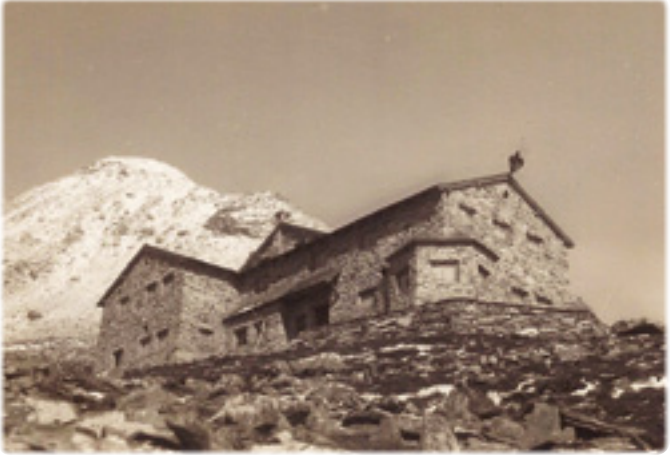
Friesenberghaus, 1929, Foto von Wilhelm Durand.

Im Jahr 1928 erwarb der Deutsche Alpenverein Berlin mit Hilfe des Alpenvereins Donauland ein Grundstück im Zillertal. Noch im gleichen Jahr ließ er für den Transport der Baumaterialien den noch heute existierenden Weg von der Dominikushütte zum Friesenbergkar anlegen. Am 3. Juli 1932 wurde das Friesenberghaus eröffnet.