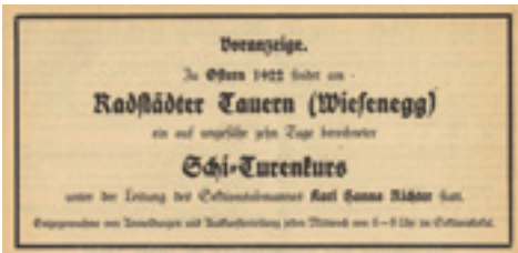
Anzeige aus den Mitteilungen der Sektion Donauland, 1922.

Nach dem Ausschluss aus dem Alpenverein im Dezember 1924 machte sich die Sektion als Alpenverein Donauland selbständig. Weitere eigenständige Alpenvereine gründeten sich zudem in München und Berlin. Diese arbeiteten eng mit dem Alpenverein Donauland zusammen.